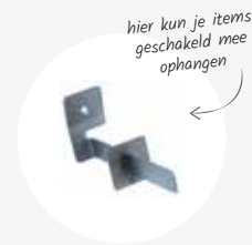
Haak met tussenstop 6,7x4x15cm