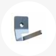
Haak enkel 5,5x4x7cm

Deze roestvrijstalen ophanghaken zijn zeer geschikt voor het ophangen van onder andere gereedschappen, schoonmaakmaterialen als bezems en borstels.