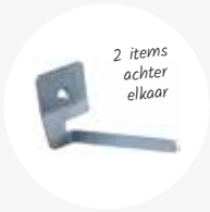
Haak lang 5,5x4x12cm