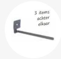
Haak extra lang 5,5x4x18cm