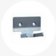
Haak dubbel 5,5x8x7cm