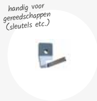
Haak klein 3,5x2x5cm